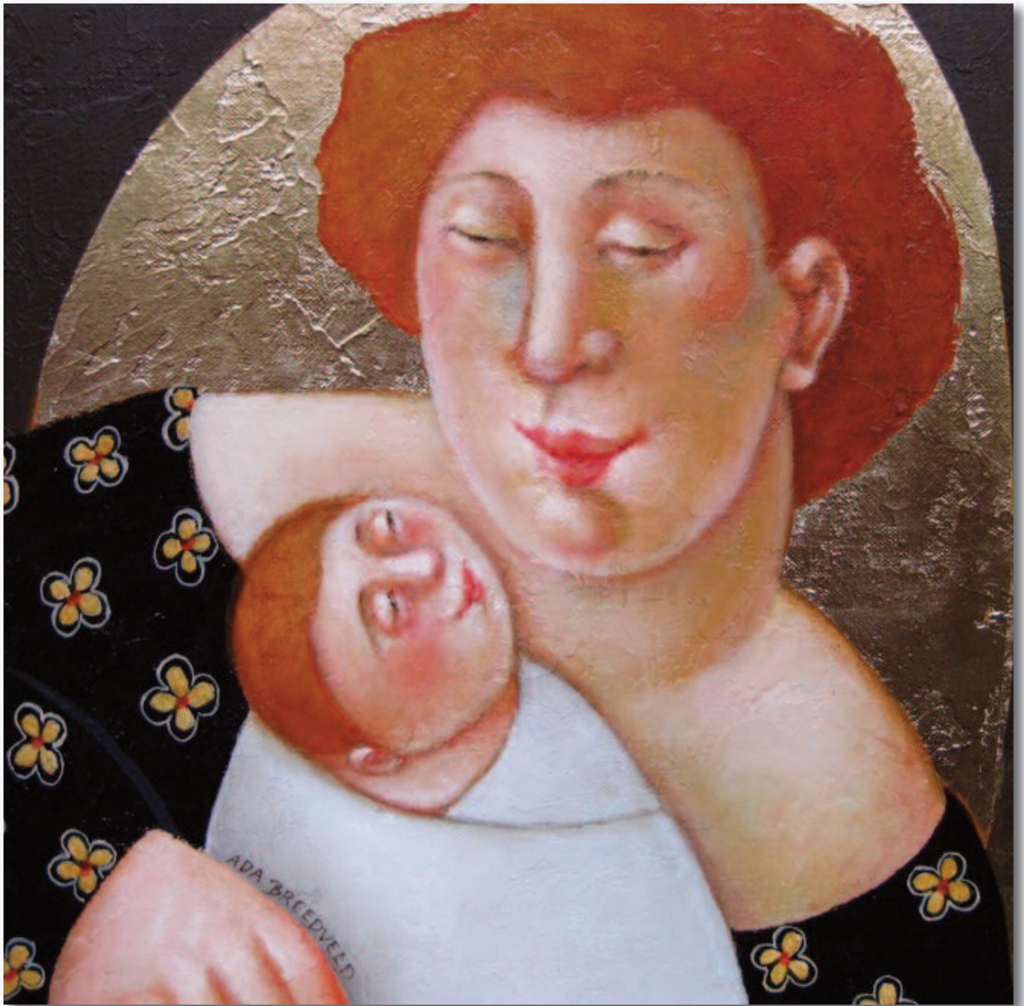
Op de vorige bladzijde: Ada Breedveld 'irdsong for a new live', 50x60 acryl/can. Boven: Ada Breedveld 'Golden Love', 30x30 acryl/bladgoud/can.