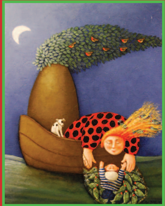
schilderij van Ada Breedveld